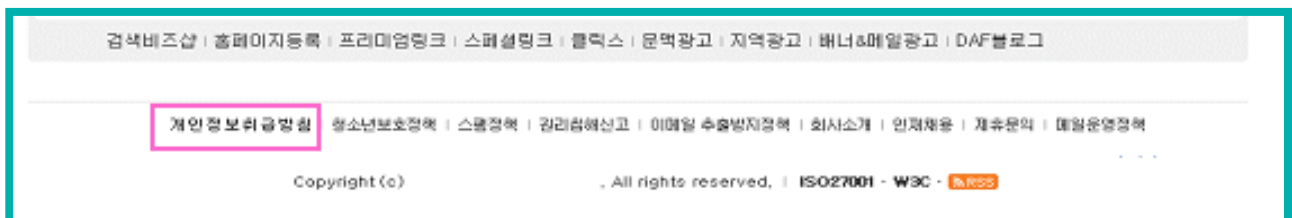
[그림 1] 홈페이지 첫화면 하단 게시 예

개인정보취급방침은 정보주체의 권리 및 사업자의 개인정보 취급에 대한 전반적인 방침에 대한 내용을 담고 있는 만큼, 정보주체가 알기 쉽고 접근하기 쉽게 공개되어야 합니다.